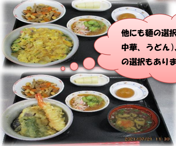
他にも麺の選択（冷やし中華、うどん）、おやつ の選択もあります！！