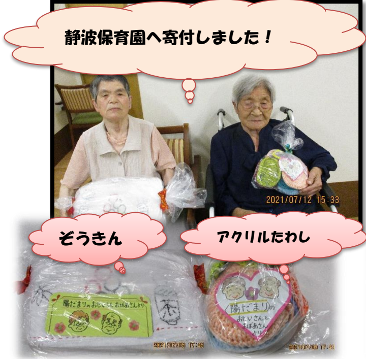
静波保育園へ寄付しました！