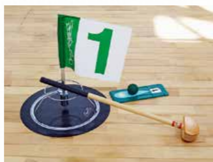
室内グランドゴルフ

レクリエーション介護機器やポップコーン機、綿菓子機の貸し出しを実施しています。サロン活動や地域での行事など、地域の方が集まるときにご活用下さい。