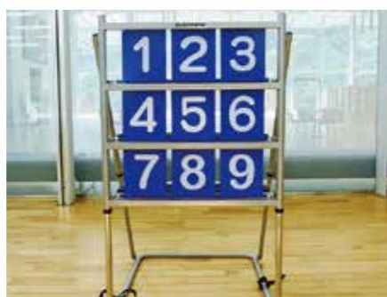
ストライクボード