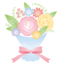
お花をありがとう