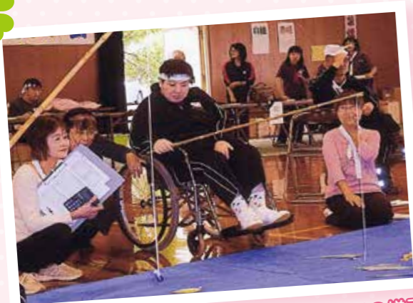
3施設合同運動会時のボランティアの様子