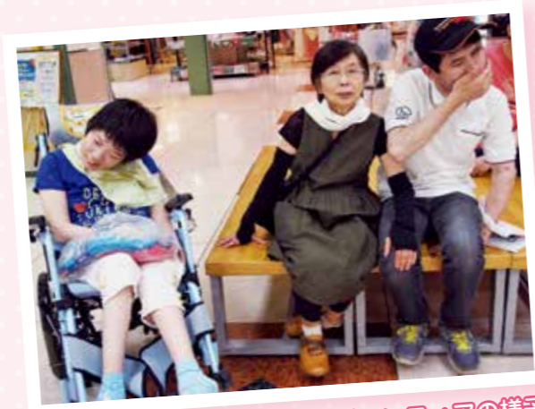
外出支援ボランティアの様子