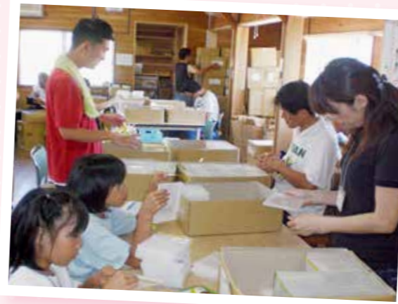
親子体験ボランティアの様子