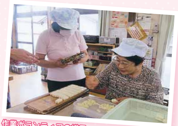
作業ボランティアの様子