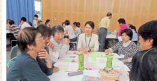
第2回 牧之原市の目指す地域像を考えよう