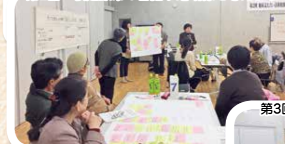
第3回 牧之原市版「課題解決の仕組みづくり」について考えよう