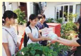
軽トラ市での様子

洗ったキャップやアルミ缶の回収を全校児童に呼びかけて、みんなが家から持ってきます。以前からお便り等で呼びかけているので、ご近所の方も小学校へキャップやアルミ缶を持ってきてくれるそうです。時には、地域で行われる行事へ福祉委員の方が出張することも・・・。