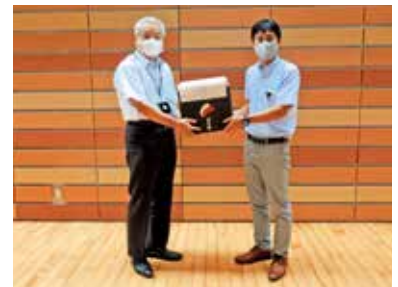
連合静岡志太榛原地域協議会 様

お預かりしたマスクは 社会福祉法人一羊会様と 社会福祉法人花草会うたしあ様に届け、 施設の利用者様に使っていただける よう有効活用させていただきます。 ありがとうございました。