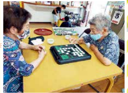
お仲間とオセロ対戦中