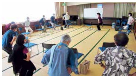
みんなでスクワット!

また、ひとり暮らしの困りごとを伺うなかで、日頃の“となり近所との支え合い”の大切さを感じました。