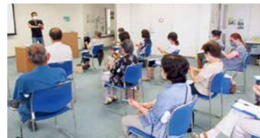
防災について勉強中!!