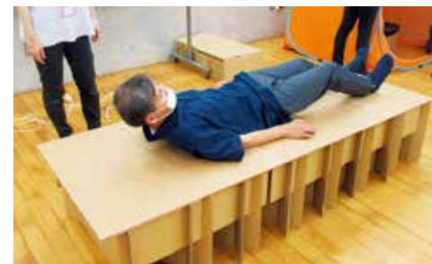
段ボールベット体験中!