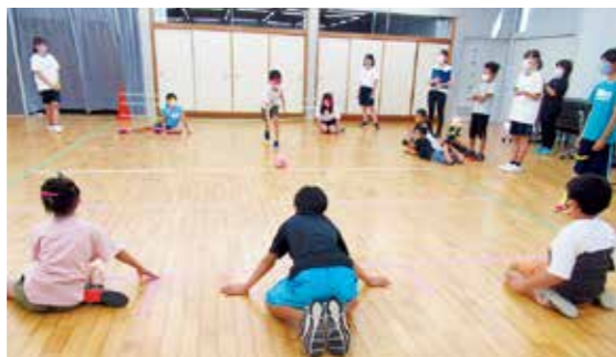
ゴールボール体験中!